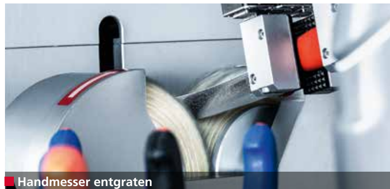
■ Handmesser entgraten

Präzise Schnitte optimieren die Produktqualität