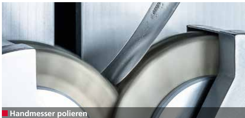
■ Handmesser polieren

Die E 50 R schleift Handmesser unterschiedlicher Form und Größe vollautomatisch.