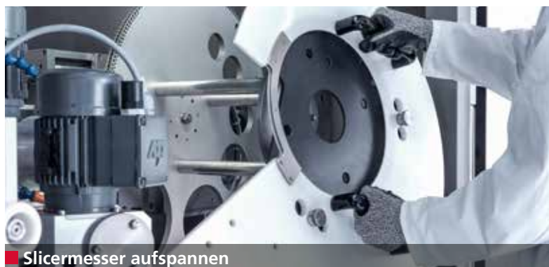
■ Slicermesser aufspannen

Des coupes parfaites, des surfaces sans stries et des produits déposés avec précision. L'A 950 II assure une grande précision d'affûtage des couteaux trancheurs, ce qui permet de répondre à ces critères.