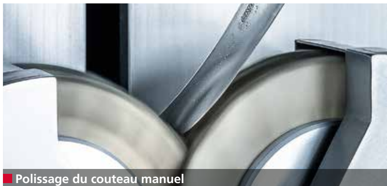
■ Polissage du couteau manuel

L'affûteuse E 50R affûte de manière entièrement automatique des couteaux à main de diverses formes et tailles.