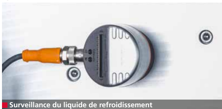
Surveillance du liquide de refroidissement

L'unité d'aspiration de série et le système de refroidissement à eau réduisent nettement toutes les émissions générées par les opérations d'affûtage et de polissage. Les voies respiratoires de l'opérateur sont ainsi protégées.