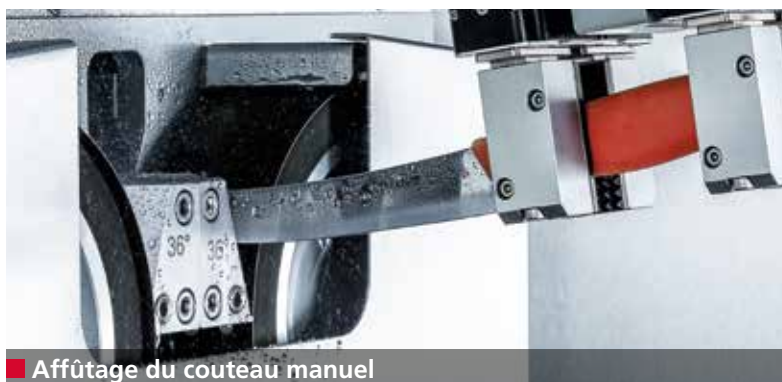
■ Affûtage du couteau manuel

Les couteaux à main parfaitement affûtés permettent d'exécuter des coupes précises. En comparaison avec un affûtage manuel, l'utilisation de couteaux à main affûtés à l'aide de la robotique de l'E 50 R permet d'obtenir un accroissement de 0,5% du rendement en viande. Pour une production de viande de 10 000 tonnes, cela représente un rendement accru de 50 000 kg.