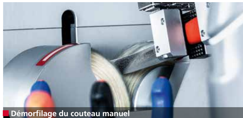
■ Démorfilage du couteau manuel

Les coupes précises optimisent la qualité du produit