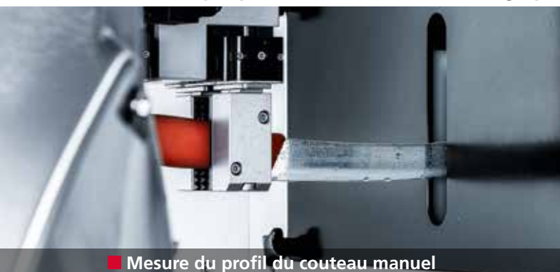
■ Mesure du profil du couteau manuel

La robotique permet d'obtenir un affûtage parfait des couteaux à main