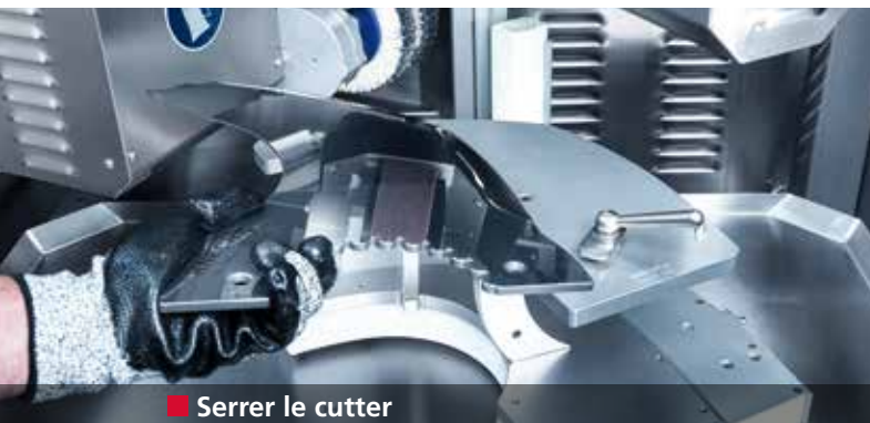
■ Serrer le cutter

Affûtage entièrement automatique des cutters