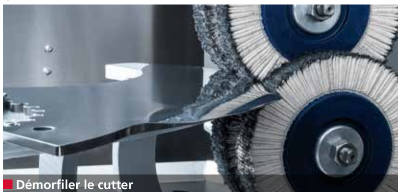
■ Démorfiler le cutter

La B 500 affûte, polit et démorfile automatiquement jusqu'à 100 cutters (500 l) par poste de 8 heures. La moyenne d'affûtage et de polissage par cutter est de 3 à 5 minutes selon sa taille.