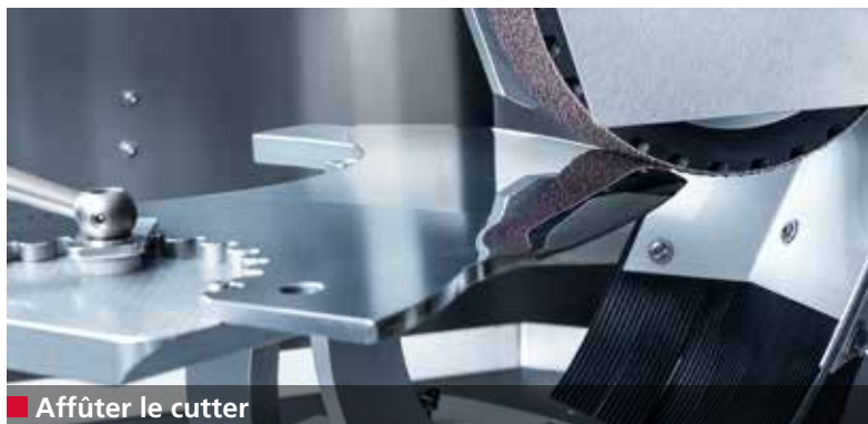
■ Affûter le cutter

Le tranchant, l'angle de coupe, la forme et le profil d'un cutter ont un grand impact sur la qualité des produits traités. La grande vitesse de coupe (jusqu'à 180 m/s – ce qui correspond à 650 km/h) et la pression latérale induisent des contraintes très importantes sur les cutters. Par conséquent, l'affûtage a un impact direct sur la résistance à la rupture des cutters.