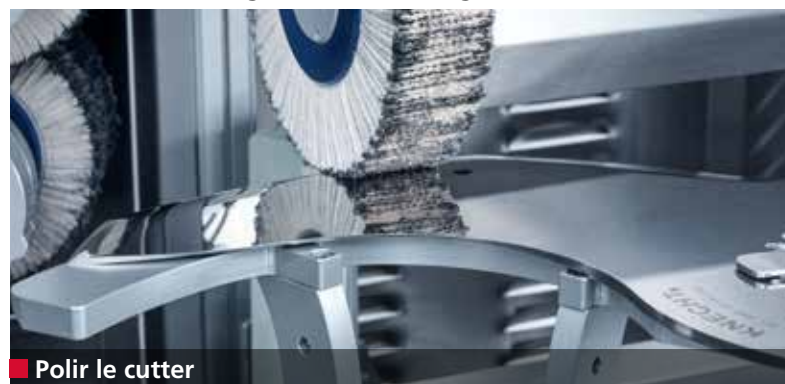
■ Polir le cutter

Polissage et démorfilage entièrement automatiques des cutters