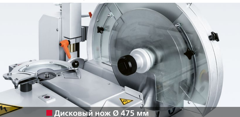
■ Дисковый нож Ø 475 мм

благодаря бережно заточенным дисковым ножам