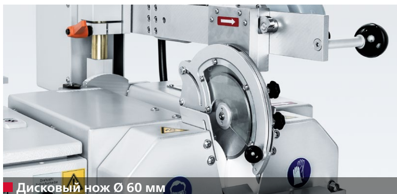
■ Дисковый нож Ø 60 мм

Острота, угол режущей кромки и ширина фаски дискового ножа имеют большое влияние на качество разрезаемой продукции.