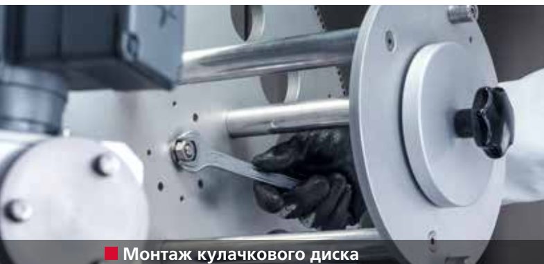
■ Монтаж кулачкового диска

Заточка ножей слайсеров в полностью автоматическом режиме