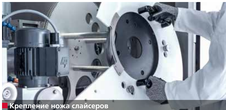
■ Крепление ножа слайсеров

Безупречное качество резки, поверхность без свилей и точно укладываемая продукция. Станок А 950 III обеспечивает высокоточную заточку ножей слайсеров, которые удовлетворяют этим требованиям.