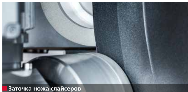
■ Заточка ножа слайсеров

Точно укладываемая продукция и безупречная поверхность