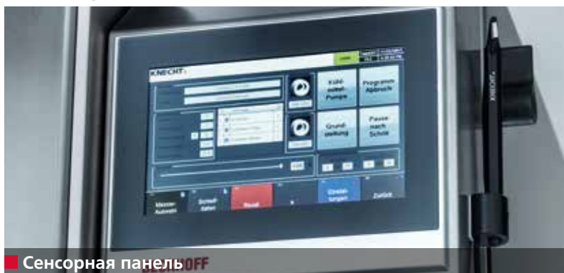
■ Сенсорная панель OFF