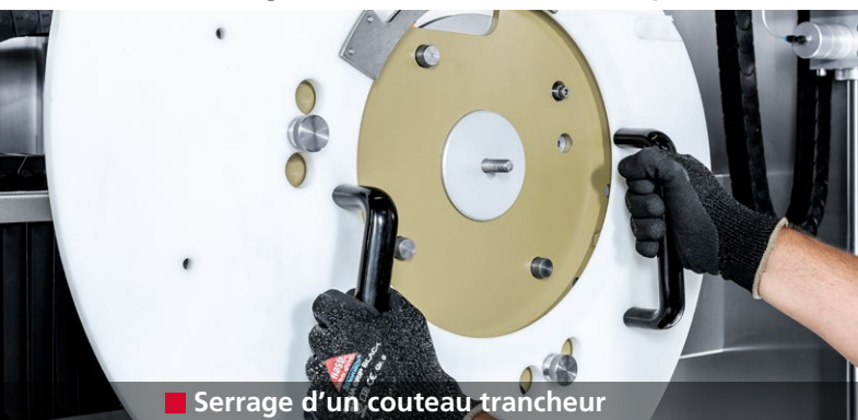
■ Serrage d'un couteau trancheur

Affûtage entièrement automatique des couteaux trancheurs