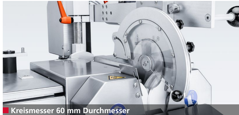
■ Kreismesser 60 mm Durchmesser

Schärfe, Schneidenwinkel und Fassenbreite eines Kreismessers haben großen Einfluss auf die Qualität der geschnittenen Produkte.