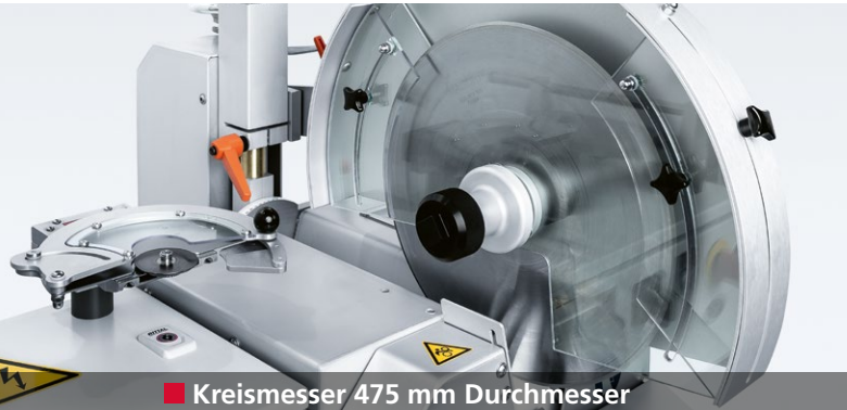
■ Kreismesser 475 mm Durchmesser